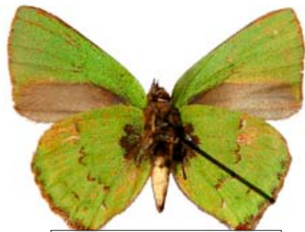
Cyanophrys remus hasoldala