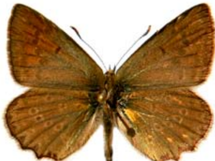
Polyommatus daphnis hasoldala

kidolgozták. Ezután aprólékos, időigényes munkával sorra vették a különböző lepkéket. Biró László vezetésével megmérték több mint száz faj szárny szerkezetét, színképi tulajdonságait, és az eredményekből adatbankot állítottak össze. „Ez az adatbank a múltat őrző múzeum szerepét is betölti, mert sajnos sok lepkefajra kipusztulás vár” – jegyezte meg Bálint Zsolt.