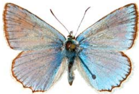
Polyommatus daphnis hátoldala