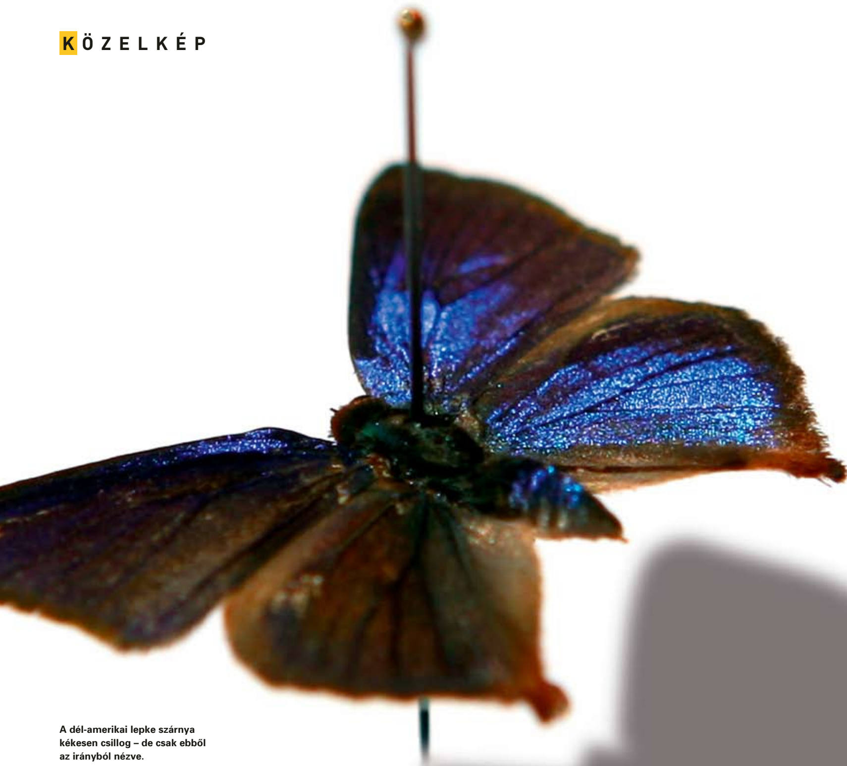
A dél-amerikai lepke szárnya kékesen csillog – de csak ebből az irányból nézve.