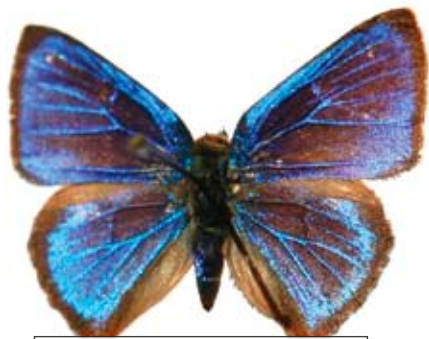
Cyanophrys remus hátoldala