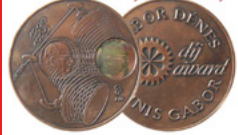
Gábor Dénes Díjasok Klubja

A program a Gábor Dénes Díjasok kezdeményezésére indult el.